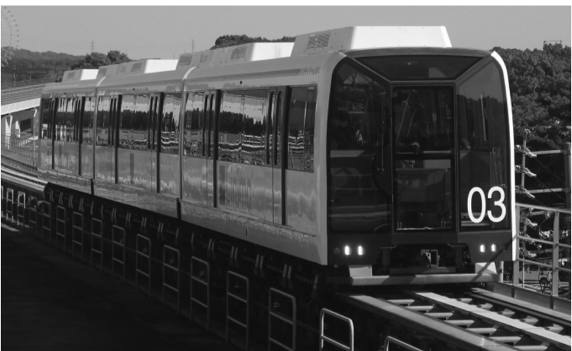
磁気浮上システムで走るリニアモーターカーは、藤が丘駅から豊田市の八草駅まで8.9kmを結ぶ。

の谷」を上から眺めながら、併せて記念撮影もできるよう、眺望施設を整備しています。